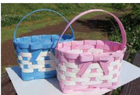
▲お弁当を入れておでかけしよう！