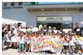
▲みんなで祝いしよう