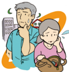
▲物忘れで困ったことはありませんか？