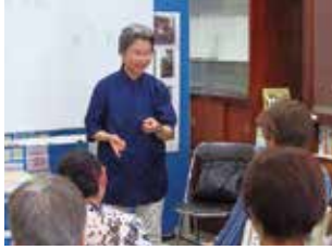
▲猛暑を乗り越えるためのポイントが学べます。