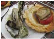
▲売り切れ次第終了となります