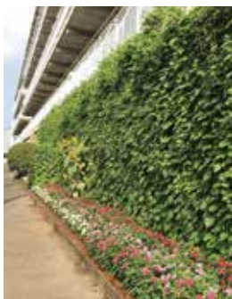
▲団体の部最優秀賞 錦田中学校

用 8月16日(金)までに申込書(市ホームページからダウンロード可)および写真を環境政策課へ直接、または kankyoushou@city.mishima.shizuoka.jp