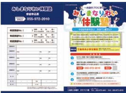
▲チラシは各小学校に配布！商工会議所にも備え付け