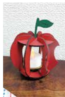
▲かわいくほのかに 光ります