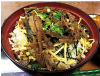
▲写真はイメージです