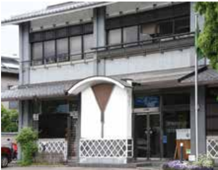
▲三島市役所大社町別館

期日前投票の対象は… 選挙日当日、次に当てはまる人 ① 仕事のある人 ② 冠婚葬祭などの予定がある人 ③ 病気やけが、妊娠などで投票所に行けない人 ④ 旅行や買い物、レジャーなどで選挙日当日投票できない人 ※投票の際には、一定の事由に該当すると見込まれる旨の宣誓書の提出が必要となります。また、投票事務手続きをスムーズに進めるため、なるべく投票所入場券の裏面宣誓書に必要事項を記入してお持ちください。ただし、投票日当日に18歳に到達する人は不在者投票となります。