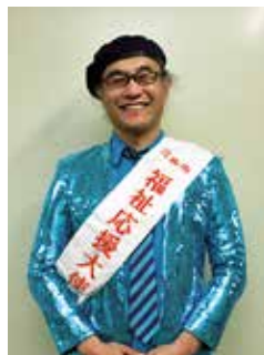
▲明るく楽しい語り口！