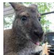
▲動物たちのかわいい写真も掲載！

https://www.instagram.com/rakujuu_mishima/