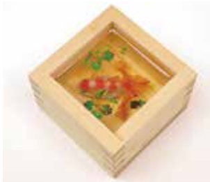
▲《金魚酒 命名 美宙（みそら）》さくらももこ旧蔵