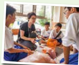
▲AEDの使い方は 知ってる？

【凡例】 時とき・場場所・内内容・講講師・費費用（記載なしは無料）・対対象・定定員・持持ち物・注注意事項・申申込み（記載なしは不要）・問問合せ