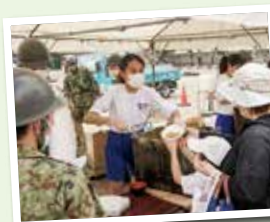
▲炊き出しは、おいしく できてるかな？