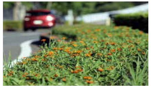
▲秋になると色とりどりの花が咲き誇ります