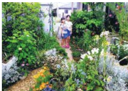
▲子どもと一緒に作った庭

を植えたり、管理したりできたら良いなと思います。また、大きなコンテストに参加し精進したいです。これからも「ガーデンシティみしま」の取り組みが広がって行くことを願います。