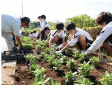
▲花街街道をジニアでいっぱい