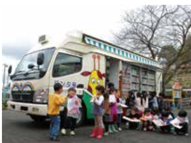
▲ジント号は自動車に本を積み、本の貸し出しを行う動く図書館です。

☝悪天候により巡回中止になる場合があります。一部指定曜日を変更する日がありますのでご注意ください。