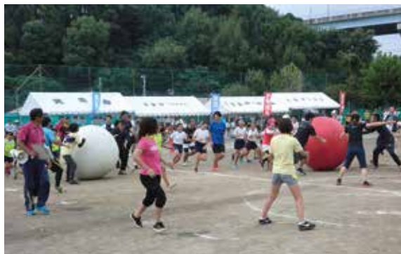
▲皆さんでスポーツイベントを楽しみましょう