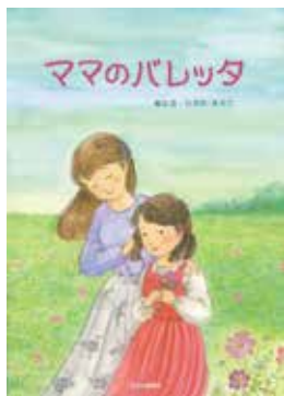
▲バレッタとは髪留めのこと