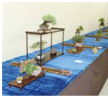
▲小品創作銘品は盆栽ファン必見