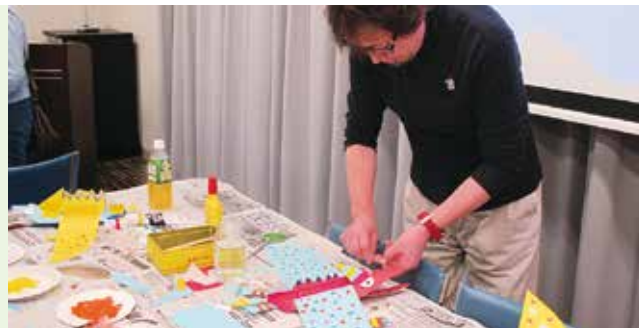
▲自分だけのプテラノドンを作ります

申10月4日(金)までに下の【基本事項】と「プテラノドン」参加希望の人は学校名と学年を文化振興課 ✉bunka@city.mishima.shizuoka.jp FAX 981・7720 QR 問文化振興課 ☎983・2756