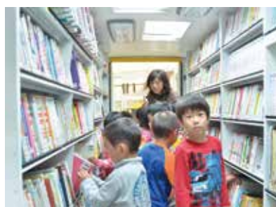
▲約3,000冊の本を載せて市内32カ所で貸し出しをしています。