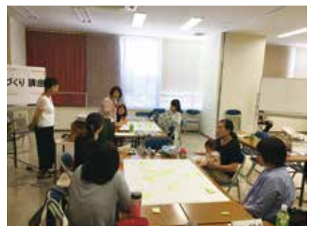
▲男性やお子さんと一緒にの参加も歓迎です