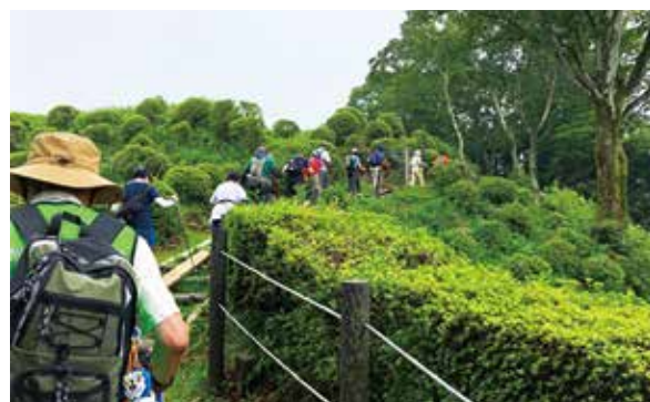
▲さわやかに、着実に歩いていきます

※数に限りがありますので、なるべく公共交通機関をご利用ください。箱根の里駐車場からはシャトルバスを用意します。