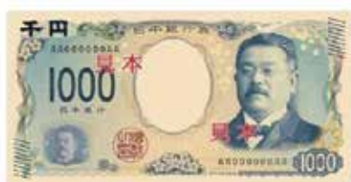
▲見本：新1000円札 表