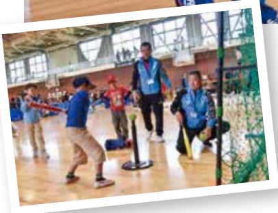
▲スポーツ・デーなどイベントのお手伝いをしています。

三島市では現在、39人のスポーツ推進委員が、スポーツの楽しさを伝えるために活動しています。