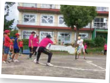
▲テニール大会などの運営を行っています。