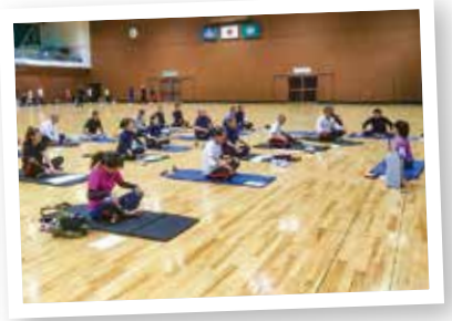
▲スポーツの技能や知識を習得するために研修会を開いています。