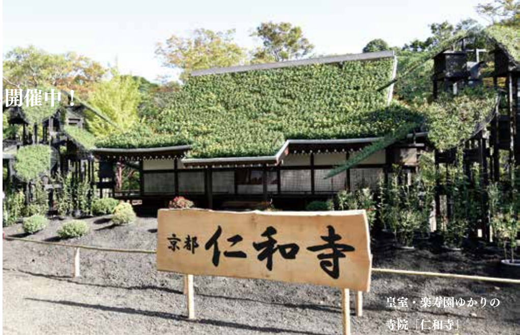
皇室・楽寿園ゆかりの寺院「仁和寺」

内 菊まつりの最後を締めくくる弾き語りイベント。静岡県を中心に活動するパフォーマーが楽寿園に大集合。あなたのお気に入りの1人、1曲を見つけませんか？