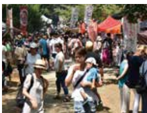
▲大盛況だった「第4回肉とビールの祭典」も当補助金を受け開催されたイベントです