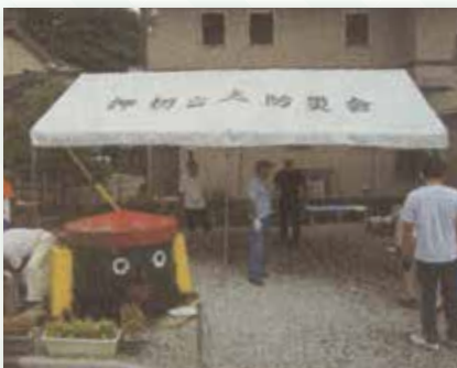
▲地域の活動も行われています

押切公園で行う1月の餅つき大会、8月のお祭りでは町内一体になって老若男女が楽しんでいるほか、老人会により防災倉庫横の花壇も綺麗に花が手入れされています。