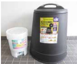
▲左：ぼかし 右：コンポスト