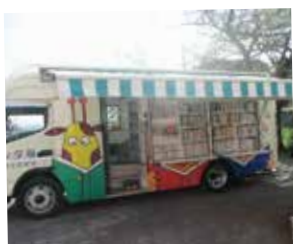
▲「シンタ号」は市内32カ所貸し出しをしています