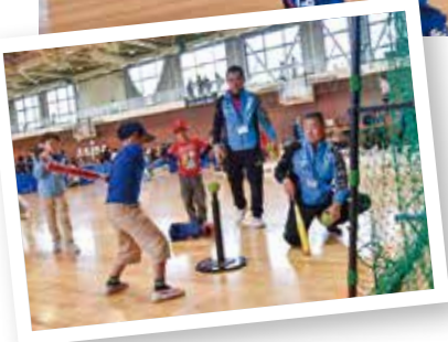
▲スポーツ・デーなどイベントのお手伝いをしています。

三島市では現在、39人のスポーツ推進委員が、スポーツの楽しさを伝えるために活動しています。