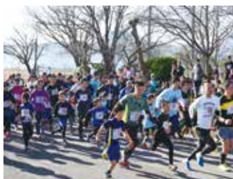
▲親子で力を合わせて走ってみませんか