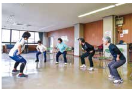
▲自分の体重を利用したトレーニングで誰でも無理なく始められます。