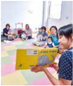
▲赤ちゃんおはなし会