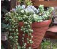
▲多肉植物の寄せ植え