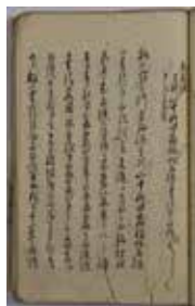
▲石道金について記す 江川代官の御用留 (江川文庫蔵)

たとえば、江戸時代後半には九〇八両の石道金が年利八パーセントで貸し付けられており、毎年七十二両ほどの収入がありました。そのうち五十七両が三島宿の助成金に回され、石畳の修繕には十五両が使われただけだったといわれています。