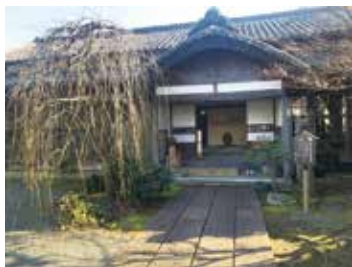
▲三嶋曆師の館（大宮町2・5・17）

住みなれた街で人生100年を生きるために「認知症にならないための生活習慣について」 時 2月25日(火)