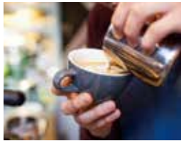
▲ラテアートの作り方を学び、交流を深めてみませんか？