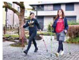
▲気軽にできる全身運動、ノルディックウオーキングを始めてみませんか？