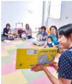
▲赤ちゃんおはなし会

時▼0〜2歳程度…18日(火) 午前10時30分〜10時50分 場中郷文化プラザ子育て交流室