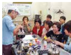
▲ 昨年の特別学習では、香り高いコーヒーを楽しみました。