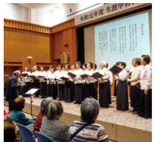
▲ 2月の生涯学習まつりでは、日頃の練習成果の発表を行います。(写真:コーラスグループ)