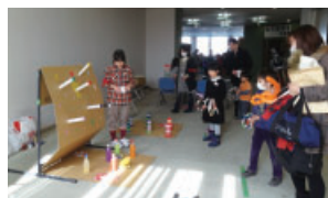
▲子ども会フェスティバルで手作りゲームコーナー運営