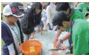
▲仲間と一緒に自ら行動できる人を目指そう！