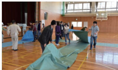
◀ 避難所開設 訓練の様子