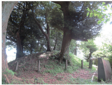
▲笹原一里塚：現在は椎の木があるが、幕末の記録では松だった

田の集落では、街道交通に関する仕事がかんでした。笹原新田でも、駕籠 かご 昇 あ り か きや旅人相手の茶屋経営などを行う住民がたくさんいました。集落内には江戸時代の旅で距離の目安となった一里塚が今も残されています。このように東海道の交通と