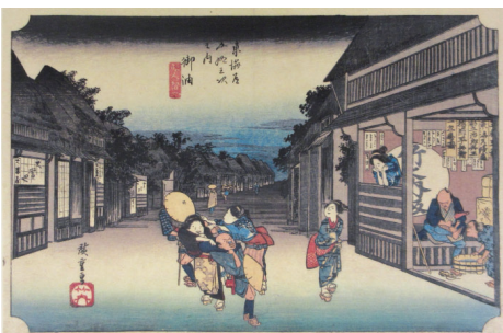
▲「御油 旅人留女」 (保永堂版『東海道五拾三次』絵巻より)

しかし、宿場の何気ない景観が主題となることもあります。例えば、広重の描いた御油宿を見てください。画面右手では旅館に着いた旅人がリラックスした様子で足を洗っています。一方、道の真ん中では宿場に着いたばかりの旅人二人が旅館の客引きの女性に引張られています。手前の旅人などは強引に首を引っ張られて苦しそうです。こんな地元の人との何気ないやり取りで旅の雰囲気伝えるのも、町をぶらりと歩いて紹介する現代のテレビ番組に通じるものがあります。