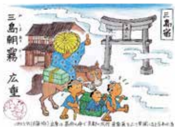
▲三嶋大社の大鳥居 マンガで描きました

約二千九百年前、富士山東斜面が大崩壊し、巨大土石流「御殿場泥流」が発生し、三島市域の南半を埋め立て、やや南に傾く平らな土地を作りました。弥生時代以降、人々はこの平坦地に住み、三島溶岩末端から湧き出す水を水田・生活用水に活用し、「三島宿」を成立させました。火山の恵みを享受し、発展してきた三島宿の特徴をよく表しているジオポイント十カ所を、静岡県地学会東部支部の協力で選びました。三島宿の歴史は楽しいマンガで紹介します。今年是小浜池の水位も高くなっています。同時にぜひご鑑賞ください。