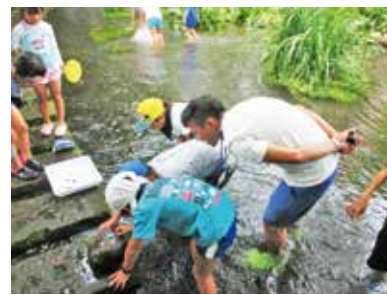
▲水生生物を調べることで、その場所の水質がわかるよ