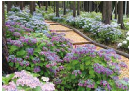
▲「あじさい祭」開催中（7月26日(日)まで）