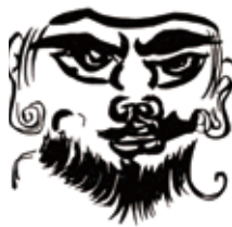
▲「箱根田遺跡（安久）で発見された人面墨書土器（右）と人面のイラスト（左）」

コロナ禍、世間では疫病を鎮める妖怪アマビエがにわかにな目されていますが、遙か昔より疫病は繰り返し人類を脅かしてきました。さて、右の土器をよく見て下さい。顔が描かれています。分かり易くするため隣にイラストを載せました。この顔は何の顔だと思えますか？妖怪でも、いたずら描きでもありません。