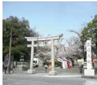
▲三嶋大社の大鳥居 小豆島産の花崗岩製です

でいます。その表層には、富士火山の火山灰が厚く積もり、「箱根西麓三島野菜」と呼ばれる特産物を生み出しました。三島宿を育んだもう一つは富士火山です。約一万年前に富士火山より流出した「三島溶岩流」は現在の三島市街地を埋め立てました。今も楽寿園より北側の各所に露出しています。