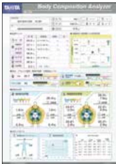
▲測定後に結果表とアドバイスがもらえます