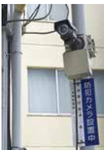
▲一番町の防犯カメラ