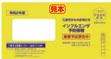
◀高齢者には予診票が黄色の封筒に入って届きます