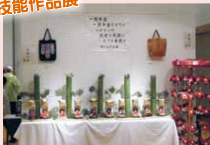
▲手芸や写真、絵画、書など技の結晶を多数展示。プロ顔負けの逸品も！