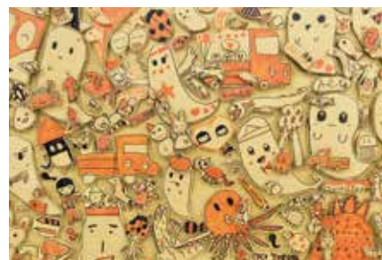
ダンボール アート作品▶

【凡例】 時とき・場場所・内内容・講講師・費費用(記載なしは無料)・対対象・定定員・持持ち物・注注意事項・申申込み(記載なしは不要)・問問合せ