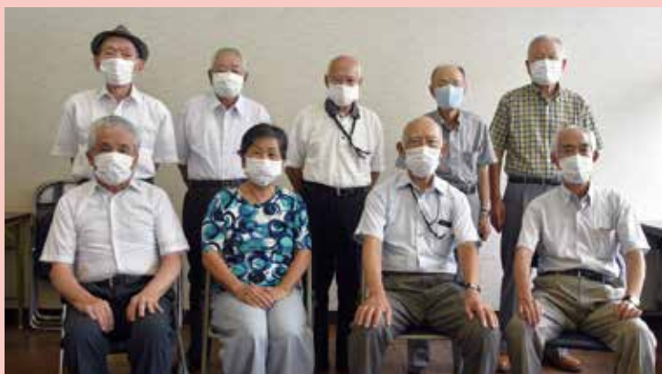
▲三島市老人クラブ連合会三役の皆さん