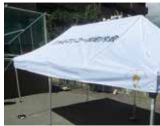
▲助成を受け購入したテント