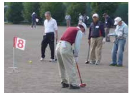
▲グラウンドゴルフは初心者でも楽しめるスポーツです

ラウンドの場合あり) 費 500円 対 市内在住、または市内のグラ ウンドゴルフクラブに所属する人 定 先着120人 申 9月23日(水)～10月2日(金)の平 日午前9時～午後5時に市民 体育館・市役所本館備え付け の申込書（市ホームページか らダウンロード可）と参加費 を直接スポーツ推進課