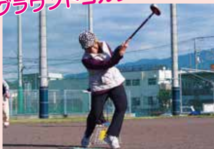
▲各クラブからの参加者約100人が腕を競い合います。目指せホールインワン！

会員だからこそできる さまざまな活動を紹介！ 現在はコロナ禍で活動を延期・縮小していますが、シニアクラブ三島の活動を紹介します。その他にも静岡県老人クラブ連合会の各活動など、盛りだくさんです。