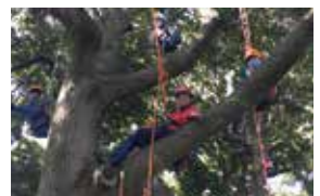
▲自然との一体感を味わえます