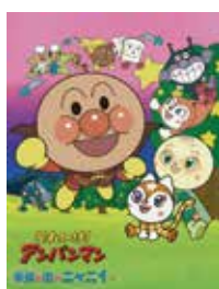
©やなせたかし / フレーベル館・TMS・NTV ©やなせたかし / アンパンマン製作委員会 2004