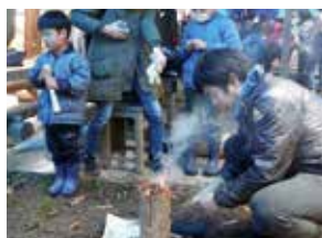
▲火おこしから焚き火を体験できます(昨年の様子)