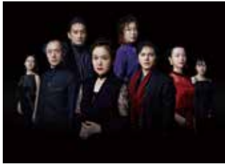
▲17世紀フランス古典文学の金字塔的な作品です

詳しくは、市ホームページ（ https://www.city.mishima.shizuoka.jp/shinsei.html ）