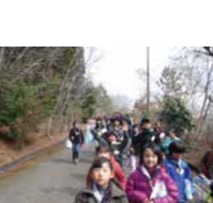
▲一昨年度の開催の様子

ブルネタリウム一般公開（2月） 時 2月28日（日） ①午前10時30分から ②午後2時から ※1回40分程度 場 箱根の里 ☎985・2131