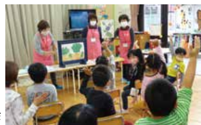
▶きゃろっとポテトの会