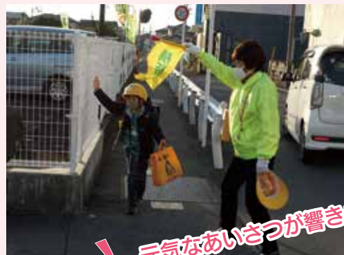
▲いつも笑顔で見守っています

小中学校は、新型コロナウイルス感染症の影響で 4・5 月の大半が臨時休業となってしまったために、学校が再開した 6 月から主に活動を行いました。雨の日も、風の日も、厳しい暑さや寒さを感じる日でも、自ら感染症対策をしながら、子どもたち一人一人にあいさつをしたり、声をかけたりしています。また各学校では、スクールガードの定例会を行い、子どもたちの様子や通学路の危険箇所などについて情報交換を行い、子どもたちが安心して登下校できるように協力しました。