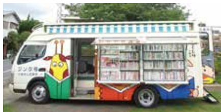
▲移動図書館車「ジント号」