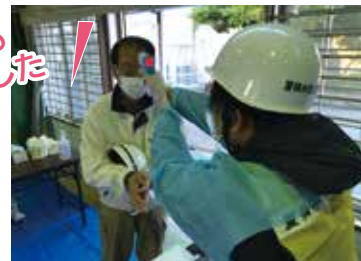
▼避難所受付での検温