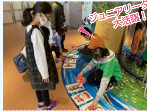
▲クリスマス会の様子

コロナ禍により活動自粛が進む中、感染予防をしながらも、7月には七夕かざり「がんばれ！MISHIMAっ子！」、9月には「昔あそびにチャレンジしよう！ in 楽寿園」、12月には「Let's enjoy クリスマス・フェスティバル」を開催しました。特にクリスマス・フェスティバルではジュニアリーダーわかばの中学生・高校生が、来場する子どもたちのためのイベントを自ら考案し、準備を行いました。当日は、ジュニアリーダーが用意したイベントを楽しそうに体験する子どもたちの姿が数多く見受けられました。