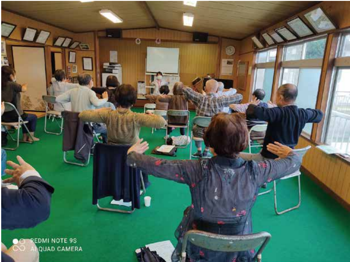
▲押切・小山台 皆さん真剣に体操に取り組んでいました

新型コロナウイルスの感染拡大により、活動などが制限されている中でも「地域のために」という気持ちを絶やすことなく、感染症対策をしながらできる範囲で、活動をしている団体が数多くあります。さまざまな分野の団体が平常時から活動しており、その活動はコロナ禍であっても、必要不可欠なものです。 市内で活動を行う団体の参考として令和2年の年末までに各団体が行った活動を紹介します。