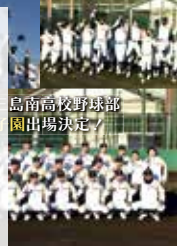
三島南高校野球部 園出場決定