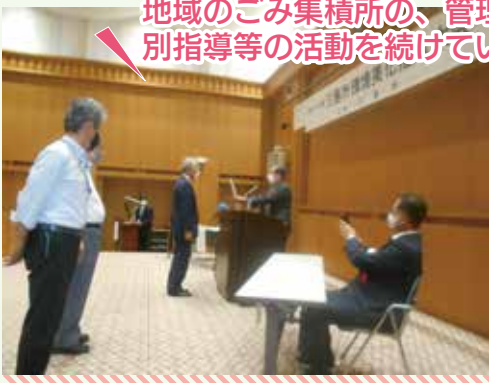
▲委嘱状交付式の様子