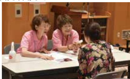
▶ 8020 推進員会