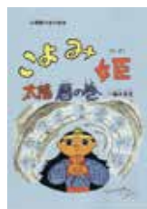
▲学習教材としても活用できます