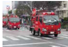
▲防火広報の一環として 毎年行われています