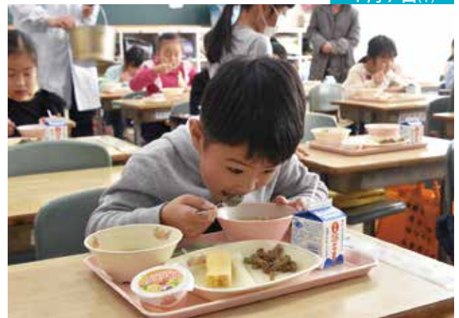
三島産の「七草」給食 <<市内小中学校>>

市内全小中学校の給食で三島市三ツ谷新田地区で栽培された七草を使った、七草がゆが提供されました。錦田小学校1年1組教室では、七草がゆを多くの児童がおかわりし、栄養士による七草の説明に耳を傾けていました。