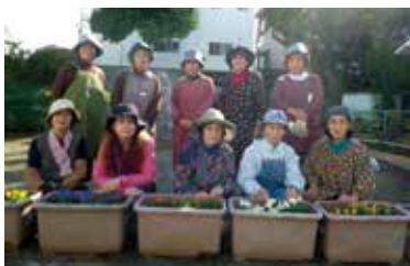
▲加屋町さくら会の皆さん

他の活動は自治会行事の参加・手伝い。年二回のガーデニング教室などです。会員を小人数に分けての作品作り、今年度から自治会扱いになった資源ごみ回収の手伝いなど、力を合わせて地域のお役に立てればと頑張っております。