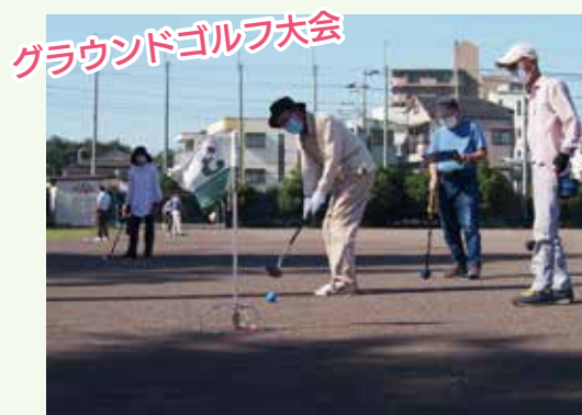
▲マスクでも、笑顔は絶えません