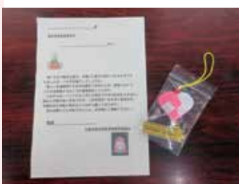
▼民生委員児童委員の気持ちのこもったチラシ