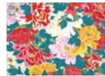
▲千代紙〈牡丹〉 河鍋暁斎 明治時代 株式会社榛原蔵

市民文化会館自主文化事業 石丸幹二&吉田次郎 -Something's Coming 2021- 時 5月16日(日) 開場：午後2時30分 開演：午後3時 場 市民文化会館大ホール 内 ミュージカル界のトップ俳優石丸幹二と、超絶技法のギタリスト吉田次郎による大人のライブ 費 全席指定（税込） S席6500円 A席4500円 ※未就学児童入場不可 チケット販売 2月27日(土) ▼市民文化会館窓口：午前9時～午後1時 問 市民文化会館 ☎976・4455 ※新型コロナウイルス感染症拡大防止対策を講じて開催します