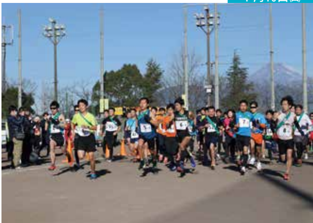
三島市「新成人」を祝う記念駅伝大会 <<長伏グラウンド>>

三島市「新成人を祝う」記念駅伝大会が長伏グラウンドで開催されました。選手たちは長伏グラウンドA～狩野川河川敷～長伏グラウンドAを周回するコース、5区間計16.2kmをタスキでつなぎました。