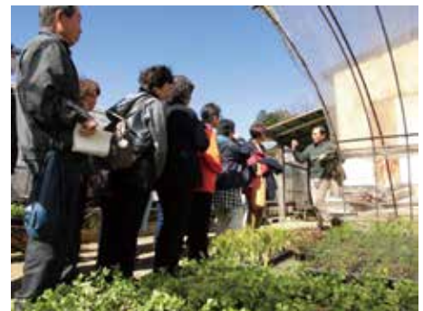
◀健幸ハーブ講習会の様子

申・■ 2月15日(月)～26日(金)までに電子申請または電話で水と緑の課☎983・2642