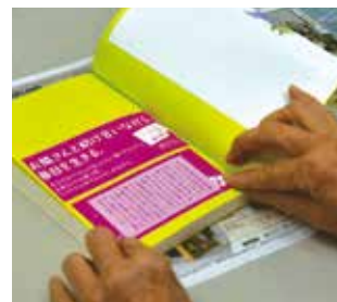
▲新刊図書の帯貼り作業：帯を切り、本に貼り付けていきます