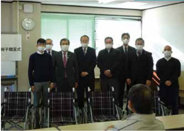
日赤有功会三島市支会が車椅子を寄贈 <<市役所>>

日赤有功会三島市支会が高齢者福祉事業の一環として市内の特別養護老人ホーム4施設へ車いすを寄贈しました。※日赤有功会三島市支会は、日本赤十字社へ20万円以上の寄付を行い、有功章を受賞した方々により昭和54年に結成された組織です。