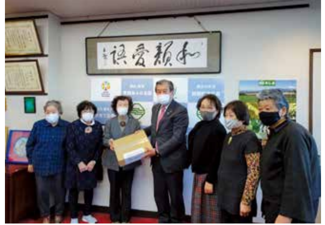
三島市赤十字奉仕団が医療用ガウンを寄贈 <<市長応接室>>

新型コロナウイルスへの感染リスクを抱えながら医療を提供する県内赤十字病院を支援するため、三島市赤十字奉仕団がビニール袋を使った医療用ガウンを作製し、静岡赤十字病院へ寄贈しました。