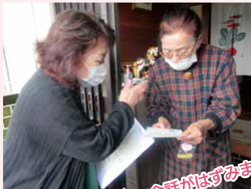
▲訪問（安否確認）実施中