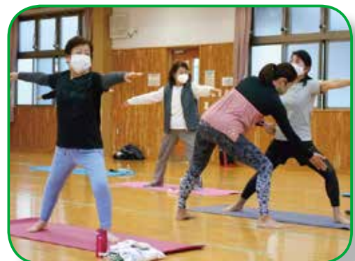
▲ヨガ（北上文化プラザ）