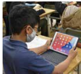
多くのアプリがインストールしてあり興味津々