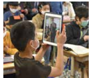
カメラ機能を使って撮影に挑戦