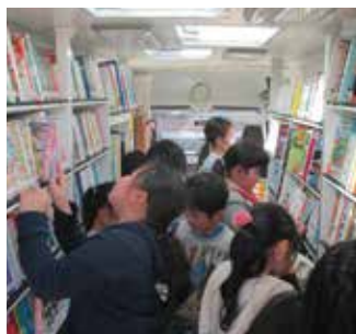
▲ジント号は、約3,000冊の本を載せ市内32カ所で貸し出しをしています

移動図書館「ジント号」 図書館貸出カードで貸し出しをします。カードのない人は、運転免許証や保険証などをお持ちください。その場でカードを発行します。 貸出は本10冊、雑誌3冊まで。約1カ月後の次の巡回日に返却してください。（悪天候により巡回中止の場合は翌々月。詳しくは図書館本館にご確認ください） 巡回日以外の返却は、図書館本館・中郷分館の窓口まで（閉館時はブックポスト）