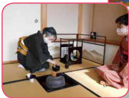
▲茶道（北上文化プラザ）

【凡例】 時とき・場場所・内内容・講講師・費費用（記載なしは無料）・対対象・定定員・持持ち物・注注意事項・申申込み（記載なしは不要）・問問合せ