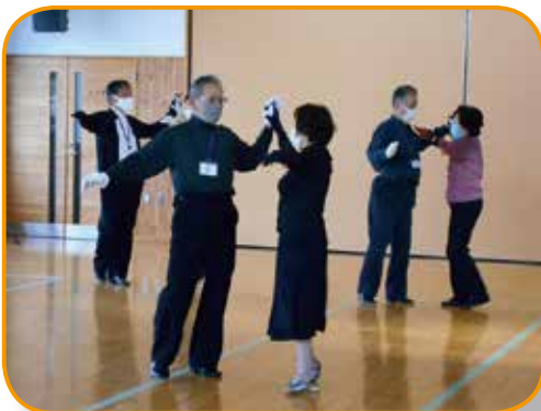
▲社交ダンス（北上文化プラザ）