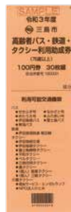
▲ 75 歳以上の人はオレンジ