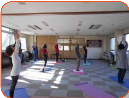
▲リフレッシュヨガ（坂公民館）