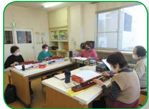
▲大正琴（中郷文化プラザ）