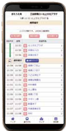
▲到着予定時間や現在地を確認できます