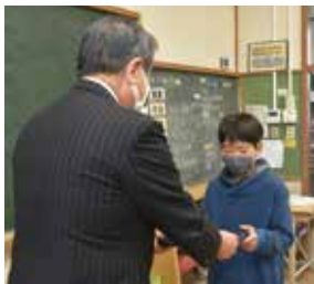
豊岡市長から代表の児童にiPadが手渡されました