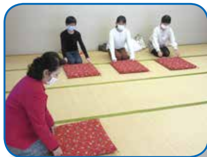
▲マナー（中郷文化プラザ）