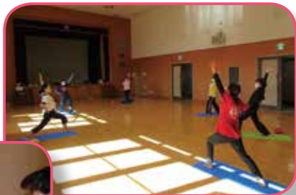
▲リフレッシュ！ボディケア （中郷文化プラザ）