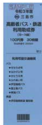
▲ 70～74 歳の人はブルー