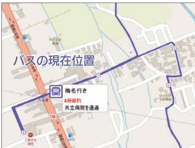
▲バスの現在地が地図上に表示 (パソコン上の表示例)