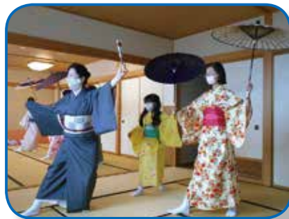
▲伝統文化（北上文化プラザ）