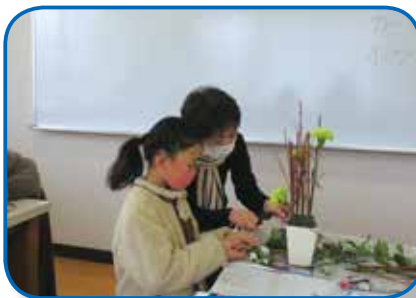
▲生け花（中郷文化プラザ）