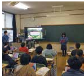
導入授業では、iPadの基本的な操作方法を説明