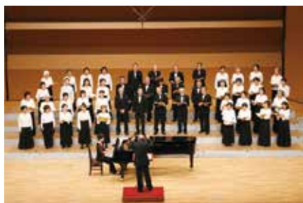
▲ステージで歌いませんか