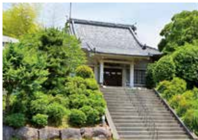
▲頼朝にゆかりのある願成寺

古道のルート上にあたります。頼朝が伊豆に配流されていたとき、平家打倒の願いを成し遂げた頼朝から贈られたと伝わるそうです。また、参道の左右には、市の天然記念物に指定されている樹齢三百年以上の一对のクスノキがあります。 緑あざやかな今の季節は、歴史ある道を歩きながら往時に思いをはせるにはぴったりですね。