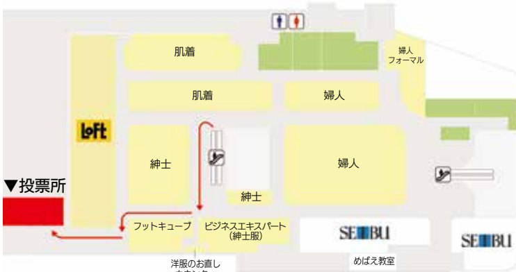
図2 臨時期日前投票所(日清プラザ・イトーヨーカドー三島店2階)

①期日前投票所 (三島市役所大社町別館) 自動車でお越しの際は、市営中央駐車場(中央町1・8)をご利用の上、投票所受付に駐車券をお持ちください。駐車券に確認印を受けることで、1時間まで無料で駐車できます。 ※大社町別館西側建物前は、歩行困難な人専用のスペースです。 ②臨時期日前投票所 (日清プラザ・イトーヨーカドー三島店) 自動車でお越しの際は、店舗の無料駐車場をご利用ください。