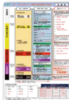
▲三島市様式を配布しています