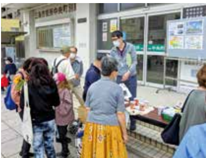
▲春の大通り商店街まつりでのオープンハウス

また、新型コロナウイルス感染症の動向を踏まえ、3月に事業進捗についての説明資料を作成し、公開・配布を開始したところ、3月から4月にかけての約1カ月間で、市役所や公民館での資料配布数は170部、市ホームページへのアクセス数は831件に