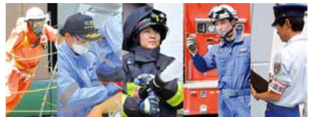
▲市民・住民の安心・安全を守るため、ワンチームで日々災害対応や訓練に取り組んでいます