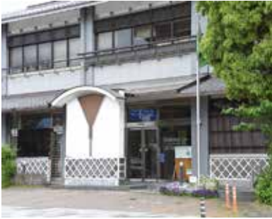
▲三島市役所大社町別館

投票時間:午前8時30分～午後8時 会場:三島市役所大社町別館(1階防災研修室) ※6月18日(金)と19日(土)は日清プラザ・イトーヨーカドー三島店に 臨時期日前投票所を開設します