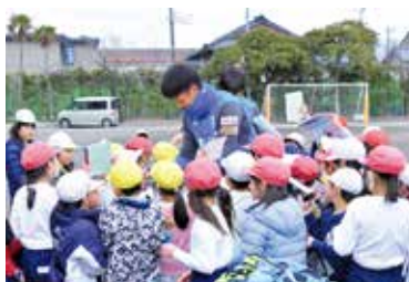
▲中郷小学校、全力教室での一場面