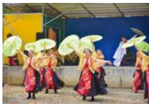
▲よさこいの演武の様子