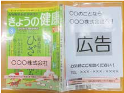
▲最新号カバー広告