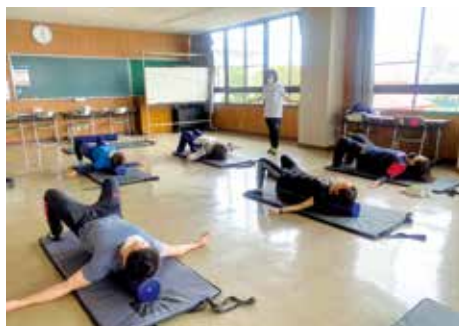
▲姿勢改善コンディショニングの様子

費300円※当日支払 対高校生以上の人数 定15人※応募多数時抽選、落選者に電話連絡 時室内用シューズ、運動着、飲み物、タオル 申・問6月20日(日)までに直接または電話で市民体育館