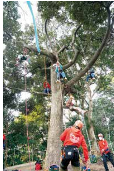
◀ 体力に自信のない人も参加できます