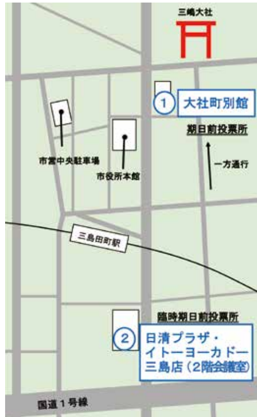
図1 期日前投票所案内図