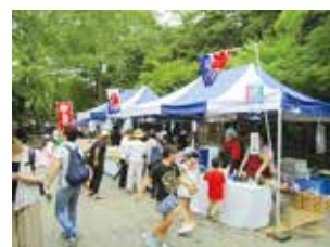
◀ 明るい時間帯のイベントをお楽しみください

【凡例】 時とき・場場所・内内容・講講師・費費用(記載なしは無料)・対対象・定定員・持持ち物・注注意事項・申申込み(記載なしは不要)・問問合せ