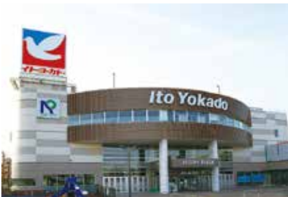
▲日清プラザ・イトーヨーカドー三島店

期日前投票の対象は… 選挙日当日、次に当てはまる人 ① 仕事のある人 ② 冠婚葬祭などの予定がある人 ③ 病気やけが、妊娠などで投票所に行けない人 ④ 旅行や買い物、レジャーなどで選挙日当日投票できない人 ※投票の際には、一定の事由に該当すると見込まれる旨の宣誓書の提出が必要です。手続きをスムーズに進めるため、なるべく投票所入場券の裏面宣誓書に必要事項を記入してお持ちください。(入場券が届かない場合でも選挙人名簿に登録されている人であれば投票することができます。)なお、投票日当日に18歳に到達する人は不在者投票が必要です。