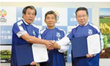
▲三島市とのパートナーシップ協定締結