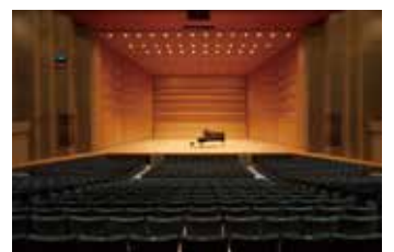
▲コンサートの雰囲気を感じてみませんか?