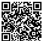
▲交通規制の詳細はこちら