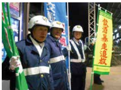
▲飲酒運転撲滅の啓発活動