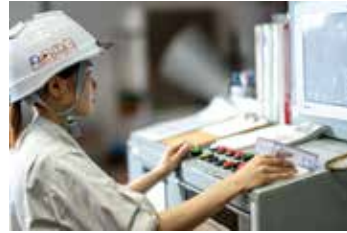
◀女性初の技能職社員 (電業社)

取組事例▶女性社員の採用比率のアップや女性社員ニーズの拾い上げを推進▶短時間勤務制度の導入により多様な働き方を推進 など