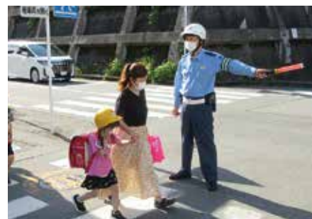
▲通学路での交通指導

「子どもの笑顔を守る」という使命感と責任感が自分を動かします。所属は異なりますが、地域の方も一緒に交通安全のために活動していることが支えになります。