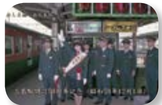
三島駅開設 50 周年 （昭和 59 年）