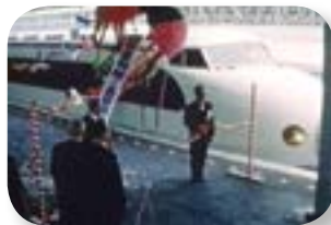
新幹線三島駅開業 （昭和 44 年）