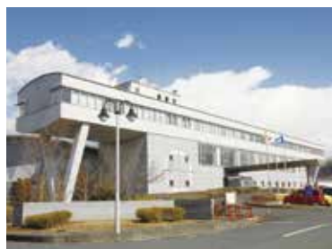
▲静岡県総合健康センター(谷田)