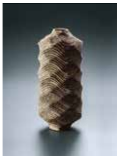
▲曲線彫文壺 1970年 岐阜県現代陶芸美術館蔵