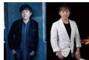
▲SALT & SUGAR