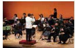
▲U-15伊豆中学生選抜吹奏楽団