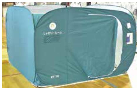
▲ワンタッチパーテーション