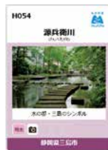
▲源兵衛川のカード

■屋外広告物とは 建物などに取り付けられた看板や土地に建てられた看板、置看板、のぼり旗、貼り紙などもすべて「屋外広告物」です。看板部分を取り付けるための枠や脚も屋外広告物に含まれます。 ■屋外広告物設置には許可が必要 表示面積が基準以内の自家広告物を除き、自らが所有する建物や土地であっても、掲出には許可申請が必要です。地域によって基準が異なりますので、詳しくは都市計画課までお問い合わせ。