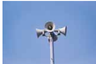
▲風水害時などは同報無線が聞き取りにくい場合があります