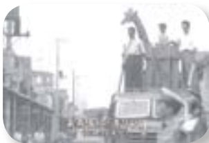
楽寿園にキリン （昭和 30 年代）