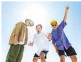
▲ベリーグッドマン