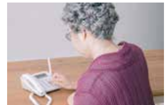
▲同報無線の放送内容を電話で聞くことができます