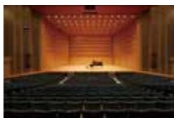
▲大ホールを独占しよう