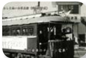
最終運行の路面電車 （昭和 37 年）