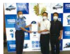
▲安全なまち宣誓式の様子

7月20日に三島警察署にて「安全なまち宣誓式」を実施しました。署長に向けて安全・安心で快適な環境を実現するために宣誓文を読み上げました。