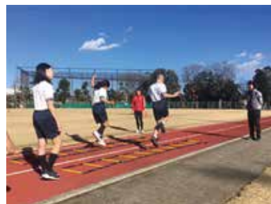
▲ランニングを学ぼう！

費 150円(保険料) 対 市内在住・在学の中学生 定 30人※応募多数時抽選 申 11月7日(日)までに①氏名(ふりがな)②学校名③学年④電話番号⑤メールアドレス⑥陸上専門種目および経験年数をメール、または電子申請 スポーツ推進課 shizuoka.jp sport@city.mishima. ☎987・7571