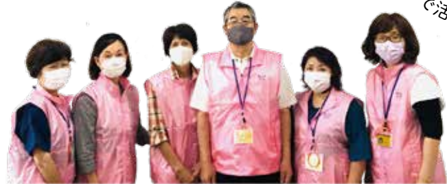
オレンジとくらの皆さん

令和3年4月に市で初めて発足されたチームオレンジ「オレンジとくら」は、徳倉にある「ハーバルケアサポート TOKURA」を交流拠点として活動しています。今後も、市内各地にチームオレンジが立ち上がることが期待されます。