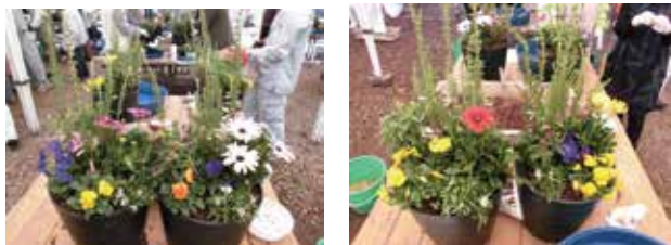
▲自分だけのコンテナガーデンを作ろう！