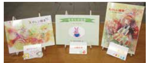
▲詳細はこちら ▲対象年齢別の作品集「たのしい絵本」