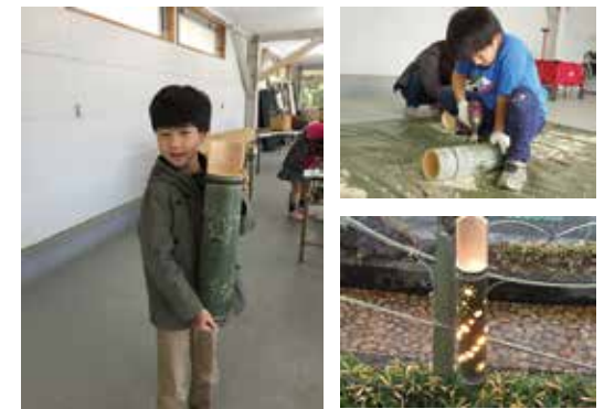
▲親子で協力して竹灯ろうを作りませんか？