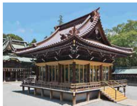
▲令和2年度に修復と耐震補強を行った三嶋大社舞殿