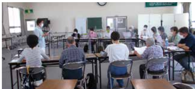
▲「オレンジリングの会」での朗読会の様子

オレンジリングの会では、認知症の人の介護に関する悩みの相談や、介護者同士の交流および認知症についてのミニレクチャーを2カ月に1回行っています。