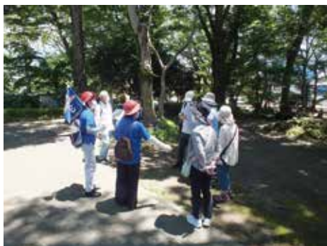
▲みしまの歴史を見て回りませんか？