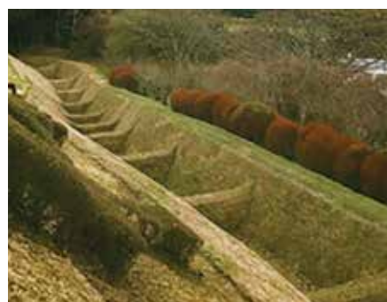
▲平成29・30年度に整備した山中城跡一ノ堀