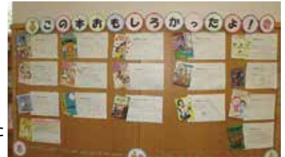
「この本おもしろかったよ！」コーナー▶