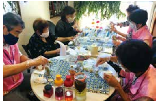
ハーバルケアサポート TOKURA での活動