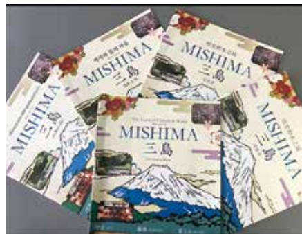
▲市内観光多言語パンフレット