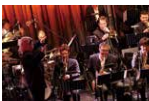
▲ジャズクラブ「ブルーノート東京」の様子