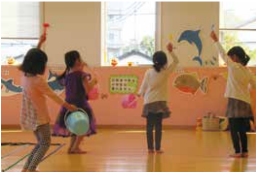
▲リトミックの様子

介護予防運動教室 ストレッチや筋力マシン トレーニングを行いながら、自宅 でも簡単にできる運動を身につ けて運動機能の向上を目指しま しょう。 時3月2日～30日毎週水曜日 午前9時～10時15分(全5回) 場老人福祉センター ヴァイターレ (佐野1150・1) 対市内在住の65歳以上で運動に 支障がなく会場まで通える人 定先着10人 持飲み物、タオル、上履き(運 動靴)