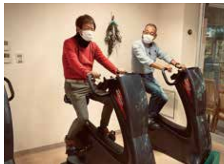
▲マシントレーニングの様子

介護予防運動教室 ストレッチや筋力マシン トレーニングを行いながら、自宅 でも簡単にできる運動を身につ けて運動機能の向上を目指しま しょう。 時3月2日～30日毎週水曜日 午前9時～10時15分(全5回) 場老人福祉センター ヴァイターレ (佐野1150・1) 対市内在住の65歳以上で運動に 支障がなく会場まで通える人 定先着10人 持飲み物、タオル、上履き(運 動靴)