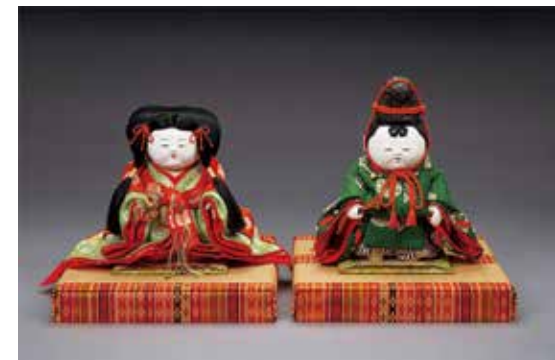
▲《おぼこ雛 内裏雛》昭和6年(1931) 佐野美術館蔵