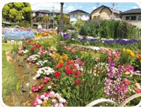
▲三島市東大場花の会さんの花壇(令和3年度市長賞)