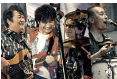
▲スターダスト☆レビューの皆さん