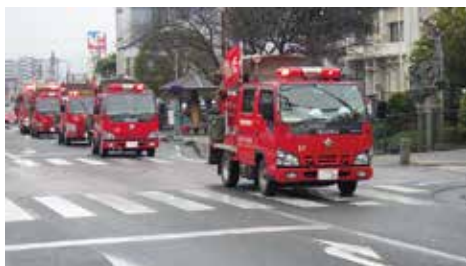
▲市内を消防車が行進します