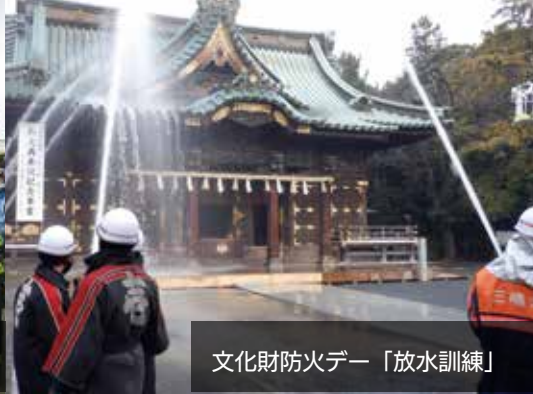
文化財防火デー「放水訓練」