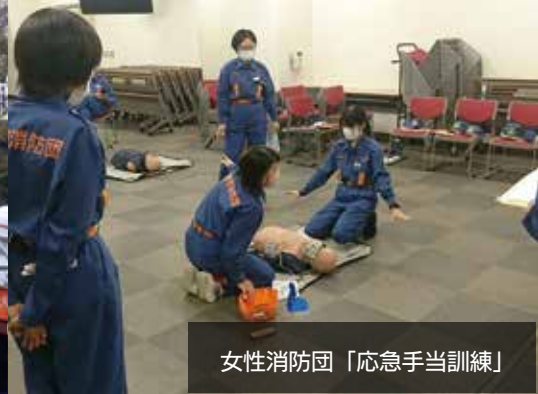
女性消防団「応急手当訓練」