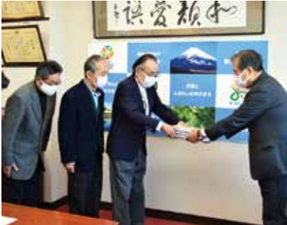
▲準備組合が市長に認可申請書を提出

組合が設立されると、実施 設計や権利変換計画作成など に着手していきます。建物の 構造計算による詳細な耐震性 の確認や、導入機能の具体化 に向け、事業の細部の検討が 進んでいくこととなります。