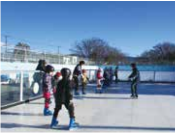
▲スケート体験してみよう

■長伏スケートリンク 令和元年に三島市長伏プール内の50メートルプールを活用してオープンしました。特殊な樹脂製プレートを敷き詰めたスケートリンクで、転んでも濡れません。 時 3月5日(土)、6日(日)、12日(土)、13日(日)、19日(土)、20日(日)、21日(月・祝)、26日(土)、27日(日) 午前9時～10時30分※雨天中止 場 長伏スケートリンク（長伏274・3、長伏プール内） 費 中学生まで1回500円 高校生以上1回800円 ※当日支払い 定 各回20人 持 手袋、靴下（スケート靴、ヘルメット、肘当、膝当は無料貸出） 申・問 NPO法人三島市スポーツ協会 ☎ 977・3800 （受付時間：午前9時30分～午後4時）