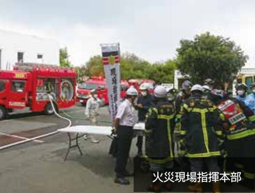
火災現場指揮本部