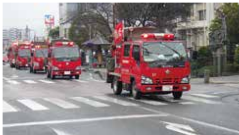
▲市内を消防車が行進します