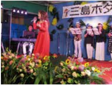
◀各種イベントも 盛り沢山です

時 6月11日(出)午前10時～午後8時 ※最終入園は午後7時45分まで 場 楽寿園(入園無料)、源兵衛川ほか 内 イベントショー、音楽演奏、模擬店、ホテルの放流、 観賞用のホテルプレゼント(午後6時から小学生以下 下先着100人) ※新型コロナウイルスの感染状況などにより、内容変 更および中止とする場合があります。 問 商工観光課 ☎ 983・2656 FMボイス・キュー ☎ 981・8600