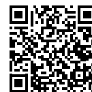
▲電子申請はこちら