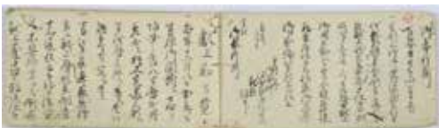
▲古文書「献上勤方覚」(個人蔵)

このように、武士の社会で由緒ある曆として認められてきた三嶋曆ですが、明治時代になると社会の近代化、西洋化の波の中でその歴史を終えることになりました。