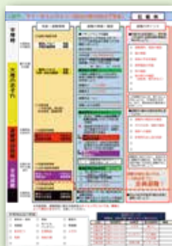
▲「三島市版マイ・タイムライン」イメージ

あらかじめ、ハザードマップで自宅が土砂災害警戒区域や浸水想定区域などの危険区域にないか、避難の際に気をつけることなどを書き出しておきます。