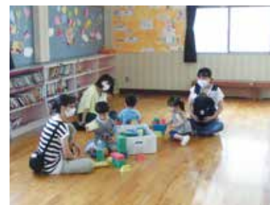
▲南幼稚園でのあそぼう会の様子