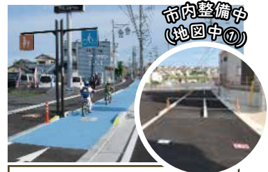
市内整備中(地図中①)

えんせき 縁石や柵などで、構造的に車道や歩道と分けられています。自転車は、必ずその部分を走りましょう。