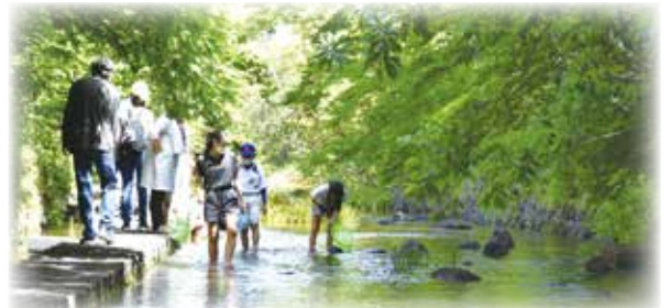
※「移住者数」は県および市町の移住相談窓口などを利用して移住した人数

令和3年度における「静岡県への移住者数」は1,868人で過去最高となり、市町別では、 三島市が171人で、県内1位 となりました。