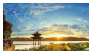
▲浙江省杭州市西湖