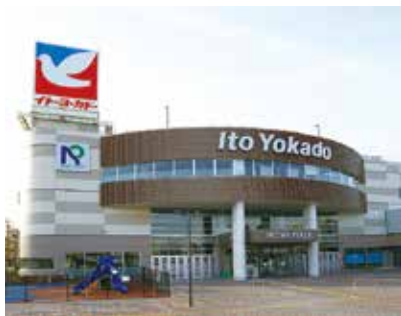
▲日清プラザ・イトーヨーカドー三島店

期日前投票の対象は… 選挙日当日、次に当てはまる人 ① 仕事のある人 ② 冠婚葬祭などの予定がある人 ③ 病气やけが、妊娠などで投票所に行けない人 ④ 旅行や買い物、レジャーなどで選挙日当日投票できない人 ※投票の際には、一定の事由に該当すると見込まれる旨の宣誓書の提出が必要です。手続きをスムーズに進めるため、なるべく投票所入場券の裏面宣誓書に必要事項を記入してお持ちください。（入場券が届かない場合でも、選挙人名簿に登録されている人であれば投票することができます。） なお、投票日当日に18歳に到達する人は不在者投票で投票ができます。