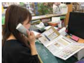
▲(株)堀江塗料の女性社員

6月1日(水)～29日(水)、図書館（市民生涯学習センター内）で関連資料の企画展示を行っています。ぜひお越しください。