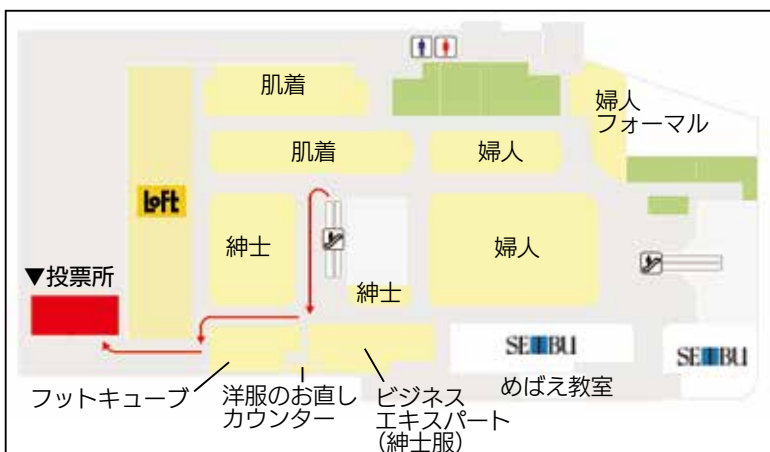
▲図2 臨時期日前投票所 (日清プラザ・イトーヨーカドー三島店2階)