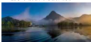
しんろうけんせんとうふうけいく ▼麗水市縉雲県仙都風景区