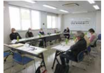
▲円卓トークの様子（北上文化プラザ）

そんな状況を改善するため、新任の会長が、ベテランの会長に相談したり、お互いに情報を共有し合ったりできる場として開催しました。（共催：三島市自治会連合会）