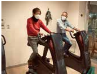
▲マシントレーニングの様子