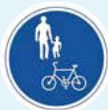
▲「自転車及び歩行者専用」の標識