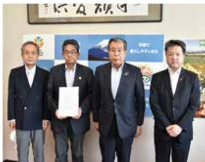
▲市長から組合設立発起人に認可書交付

のステップがあります。今後 は組合として、残る1つの権 利変換計画認可に向け、実施 設計業務や、権利変換計画作 成業務に着手していきます。 認可を受け、市長から組合 設立発起人に認可書の交付を 行いました。出席者からは、 「認可を待っている間、多く の方から期待の声をいただい た。今後は組合として、心を 一つにして事業を進めていき たい」と決意が述べられました。 市としても、組合ととも に、より良い事業となるよう 協議・検討を重ねていきます。