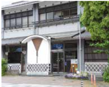
▲三島市役所大社町別館

※7月7日(木)～9日(土)は、日清プラザ・イトーヨーカドー三島店に臨時期日前投票所を開設します