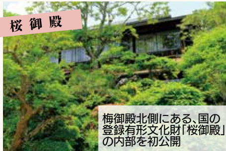
梅御殿北側にある、国の登録有形文化財「桜御殿」の内部を初公開