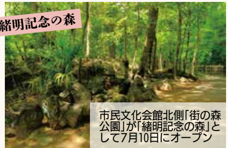
市民文化会館北側「街の森公園」が「緒明記念の森」として7月10日にオープン