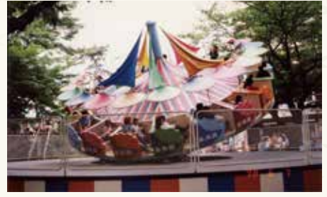
▲平成21年まであった「トラバンド」などの写真を展示

キリンやゾウなどの写真や歴代の菊まつり盆景の写真で、楽寿園の歩みを振り返ります。 【ところ】園内展示場