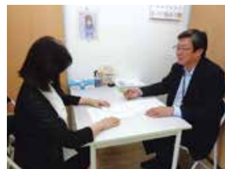
▲相談員が親身に対応します

あなたのさまざまな今と一緒に考え、寄り添って、問題解決につなげていきます。 今まで声をあげられなかった人や問題を抱えている人を周りで見つけたときに も、ぜひ、センターにお知らせください。