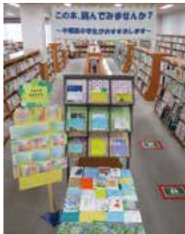
▲力作POPとおすすめの本