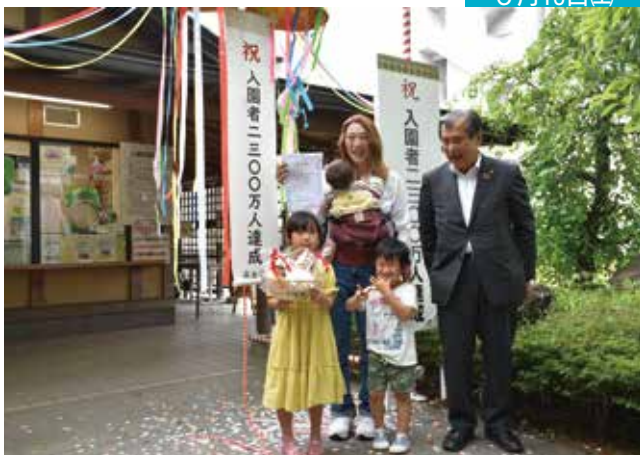
楽寿園入園者数 2,300 万人達成！ <<楽寿園>>

楽寿園の入園者数が2,300万人を達成し、記念セレモニーが行われました。昭和27年の開園から入園者2,300万人目となった沼津市にお住まいの福田さんファミリーには、記念品が贈られました。