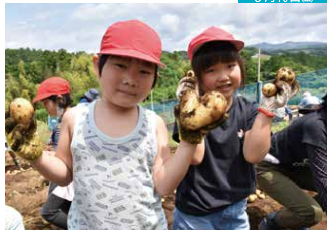
坂小学校「三島馬鈴薯の収穫」 <<坂小学校学校農園>>

坂小学校の学校農園で「三島馬鈴薯の収穫体験」が行われました。この日は、1年生から6年生までの児童が参加し、3月に植えた三島馬鈴薯（メイクイン）の収穫体験を行い、子どもたちは友人同士で協力しながら、特産品の収穫に汗を流しました。