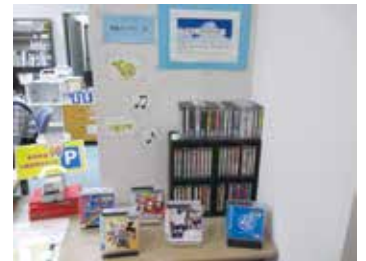
▲吹奏楽に関するCDを展示

中郷西中学校の生徒さんにおすすめの本のPOP (本の紹介カード) を作成してもらい、本と一緒に展示しています。力作が揃ったPOPをぜひご覧ください。