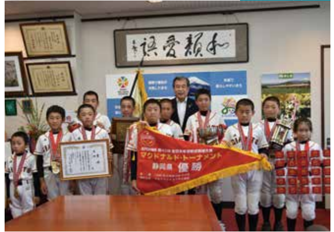
リトルジャイアンツ全国大会出場決定 <<市長応接室>>

「高円宮杯第42回全日本学童軟式野球マクドナルド・トーナメント静岡県予選」において、見事優勝を果たし、全国大会出場が決定した「リトルジャイアンツ」が市長報告のため、市役所を訪れました。