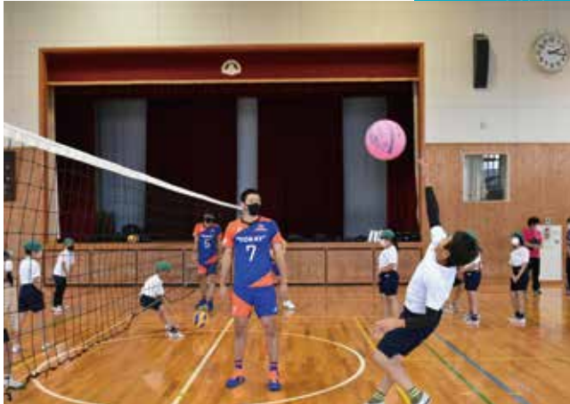
東レアローズが北小で体験授業 <<北小学校>>

東レアローズ男子バレーボール部の選手9人が、バレーボールのおもしろさを伝えようと5年生児童に対し、体験授業を実施しました。児童は手を伸ばしても届かないネットを前に、一生懸命ジャンプしてアタックをきめていました。