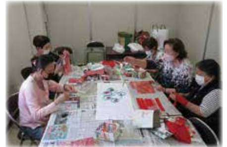
▲マスコットを作成する女性指導員

交通安全に関する啓発品としてマスコットを作成し、関係各所に寄付します。また、研修会や他市町の女性指導員との交流会にも参加しています。