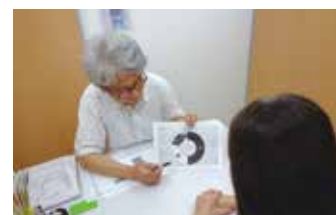
▲家計改善は家計の見える化から

多重・過剰債務や悪質商法の相談、税金や公共料金などの滞納、支払先の相談、生活資金についての相談など、既存の制度・事業を活用し、関係機関へつなぎながら問題解決への支援を行います。