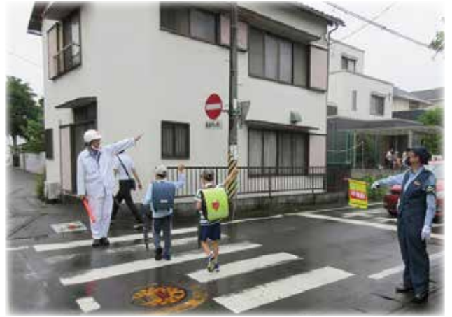
▲朝の通学路見守り指導

初心者研修もあります。安心してご参加ください。私自身27歳のときから指導員として活動しています。20～30代の人でも大歓迎です。