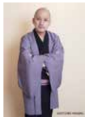
▲春風亭一之輔さん