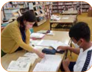
▲外国人児童に寄り添った授業

外国人の中には、家族で三島に引っ越してくる人もいます。市内の小中学校に在籍する外国籍や外国にルーツを持つ子どもも増えていることから、「やさしい日本語研修」を実施し、児童や家族に寄り添った支援をしています。