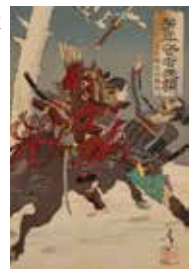
▲月岡芳年《芳年武者无類 左兵衛 源頼朝》明治16年(1883)頃 浅井コレクション