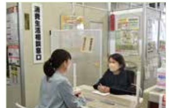
▲市民生活相談センター