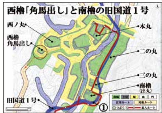
▲西櫓「角馬出し」と南櫓の旧国道1号

西櫓の「角馬出し」は、城から敵を迎え撃つための騎馬をためていた場所になります。その広さをせまくして、堀の区画を二重に広げました。そして橋も橋脚台も取り除いて、西櫓を含めて堀幅に加えたと考えられます。鉄砲戦に備え、西ノ丸を最前線として迎え撃つ体制を整えていたと想像されます。