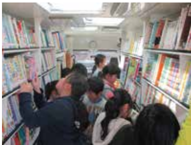
▲ジンタ号は市内34カ所で貸出をしています