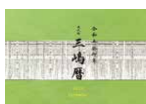
▲三嶋暦カレンダー(表紙)