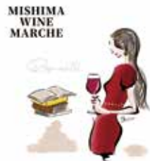
▲イベントフライヤー