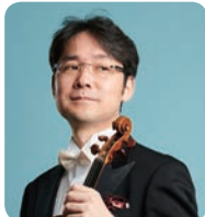
矢部達哉 (ヴァイオリン)