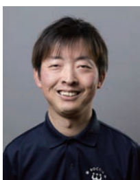
▲杉村英孝選手 (ボッチャ日本代表)