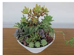
▲多肉植物の寄せ植えに挑戦しよう!

申・問 1月18日(休)までに水と緑の課 ☎ 983・2642 QR ※作成するものは写真とは内容が異なる場合があります。 三島市観光戦略アクションプラン(案)にかかるとパブリックコメント募集 当案件を策定するにあたり、皆さんの意見を広く募集します。