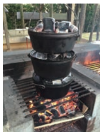
▲ダッチオーブンでキャンプ料理に挑戦しよう!