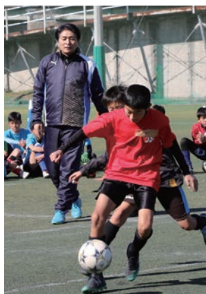
▲サッカー教室の様子