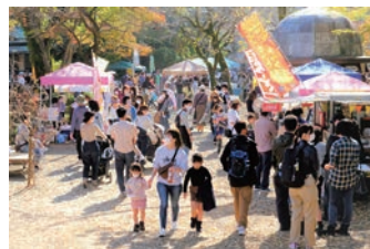
▲冬も楽寿園のイベントで楽しもつ!