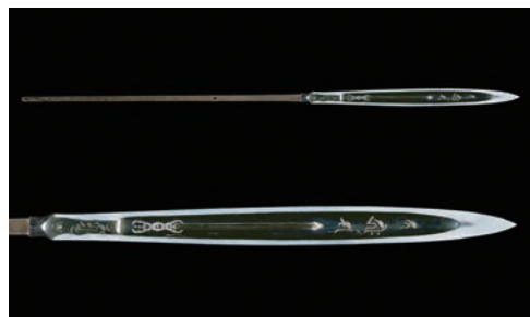
▲大笹穂槍 銘 藤原正真作〈号 蜻蛉切〉 室町時代 個人蔵