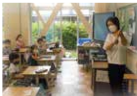
▲絵本の読み聞かせ