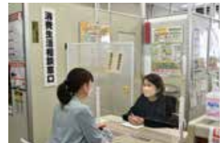
▲相談センター窓口