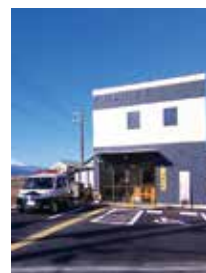
▲新しくなった中郷交番

交番勤務員一同も心機一転、地域住民の安全安心のために警察業務に邁進していきます。 問三島警察署 地域課 ☎981・0110 問地域協働・安全課 ☎983・2765