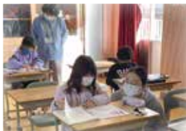
▲放課後の学習支援