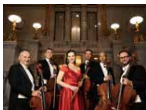
▲ ウィーン チェロ・アンサンブル5+1

組曲《黄金時代》Op.22 a よりアダージョ ▼ チャイコフスキー…ロココ主 題による変奏曲イ長調Op. 33ほか