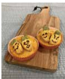
▲かわいくておいしい野菜マドレーヌ!