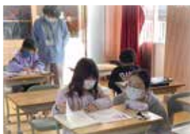
▲放課後の学習支援