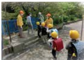
▲登下校見守り活動 「スクールガード」