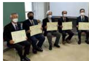
▲表彰された5団体の皆さん

令和4年11月22日(火)、県主催の「令和4年度子供を育む地域活動団体表彰」が行われ、坂・西・沢地小学校、北・北上中学校の各地域学校協働本部が、長年にわたり地域の諸団体と連携・協力し、地域で地域の子どもを育む体制づくりを推進する団体として功績を認められ、静岡県教育委員会教育長より表彰されました。