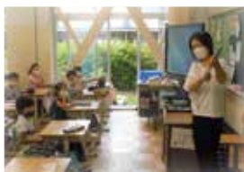
▲絵本の読み聞かせ