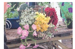
▲ファイブスリットハンギング

申・問5月19日(金)までに電子申請またはみどりと水のまちづくり課☎983・2642