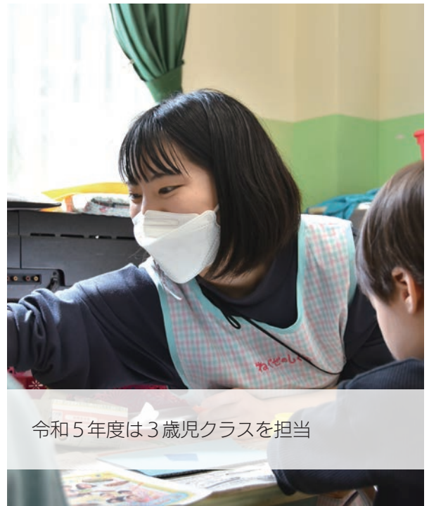
令和5年度は3歳児クラスを担当