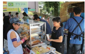
▲世界の料理を楽しむ様子