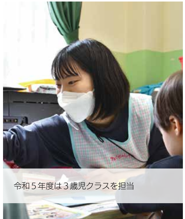
令和5年度は3歳児クラスを担当