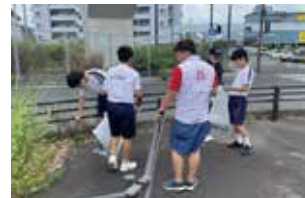
▲通学路をキラリ！大作戦

通称「みなみライフセイバーズ (MLS)」として、生徒の安全・安心な学校生活、学習環境を整える活動を行っています。主な活動内容として「通学路をキラリ！大作戦 (通学路清掃)」「長期休業中の学習支援」「入試前の模擬面接対応」などがあります。MLS のメンバーは、地域・学校・家庭が一緒になって、全ての子どもたちを見守り、育てていくために力を尽くしています。