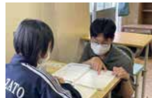
▲大学生も学習支援に参加

生徒の学習環境を整え、安心して学校生活を送ることができるようにと、「放課後学習支援活動 (NGO)」「授業支援」「環境整備活動 (草刈り隊) (花壇整備)」「読み聞かせ」を行っています。生徒たちにはそこからたくさんのことを学んでほしい、地域の方は生きがいにつなげてほしいという思いから、どの活動も生徒と地域の人と一緒に活動することを大切にしています。