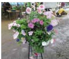
▲ファイブスリットハンギングバスケット