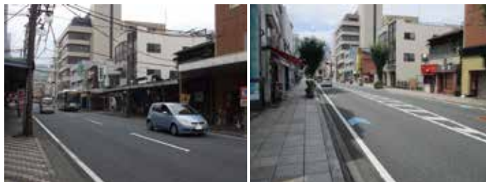
▲無電柱化した(主)三島停車場線(芝町工区) ※左:施工前、右:施工後