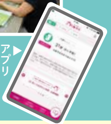
アプリ「みしまっこ」