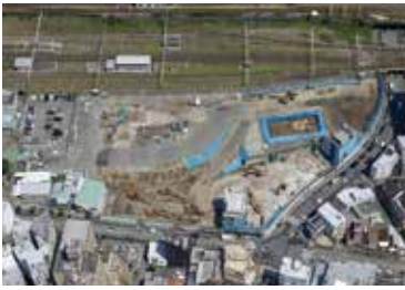
▲工事現場写真

今後も、多くの皆さんに喜んでいただける事業としていくための取組を継続していきます。