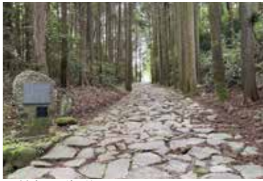
▲箱根旧街道石畳 (山中新田：腰巻地区)

「日本遺産をご存知ですか」と聞かれたら、多くの人が「世界遺産なら知っているけれど、日本遺産は聞いたことがない」「日本遺産は世界遺産登録を狙っている日本のいいものかな」といった答えをされると思います。「世界遺産」と「日本遺産」、言葉としてはよく似ていますが、考え方はかなり違います。簡単に言うと、「世界遺産」は文化財(文化遺産)そのものの価値付けを行い、保存することを目的にしたものです。オース