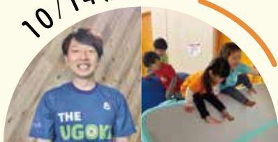
ステージイベント ほか