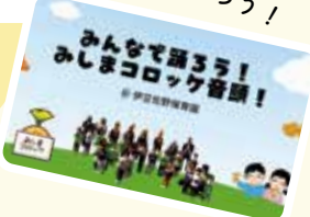
みんなで踊ろう! みしまロック音頭!