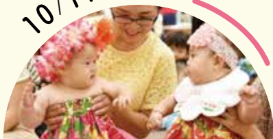
ハワイアンリトミック ほか