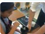
タリーズコーヒー バリスタ体験!