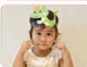
来年の干支と一緒に 写真を撮ろう!