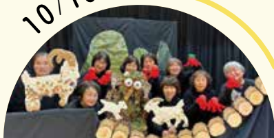
りぼんクラブお話し会 ほか