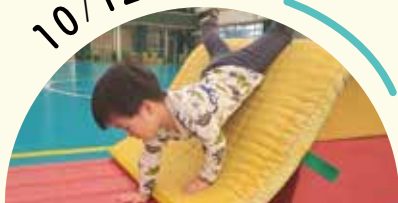
ウェルネスイベント ほか