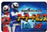
アーマードポリス参上! 警察音楽隊ステージ!