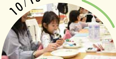
豆つかみゲーム ほか