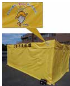
▲宝くじの助成金で整備したスモークハウス

宝くじによる社会貢献広報を目的とした、コミュニティ助成事業による助成金で、防災訓練などの啓発で使用するスモークハウスを消防団へ整備しました。 ☎危機管理課 972・5820