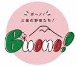
▲参加店舗にはこのロゴマークの看板などが設置