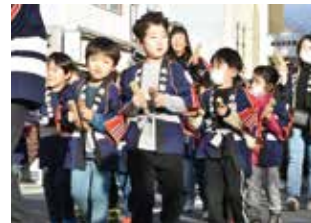
▲幼年消防クラブもパレードに参加します