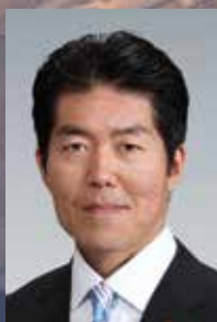
三島市議会議員長

結びに、本年が市民の皆さまの笑顔と希望にあふれる実り多き一年となりますことを心よりご祈念申し上げます。年頭のご挨拶とさせていただきます。