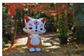
▲ゲーム宣伝隊長のおっかい こんのすけ (2017年12月楽寿園にて)