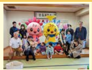
～記念撮影～ みんな笑顔で仲良しに！