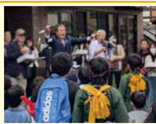
～地域との交流～ 地域のみなさんと「餅まき」