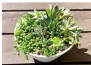
▲寄せ植え制作イメージ