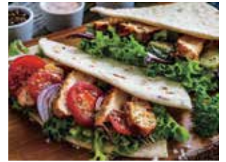
▲ピアディーナ(サンドイッチ)