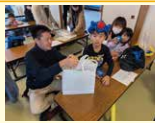
～プレゼントタイム～ 町内会からお祝いのプレゼント