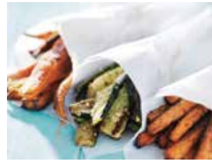
▲野菜のフリット（フライ）