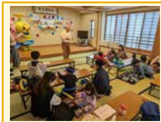
～お祝い会スタート～ 町内会役員のみなさんがお出迎え

▼▼▼▼▼ 今回は、11月23日に大場町内会が行った「お祝い会」の様子をご紹介します。 ▼▼▼▼▼