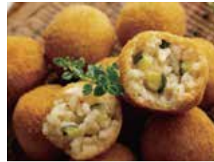
▲アランチーニ（ライスコロッケ）