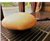
▲ふわふわかすてら