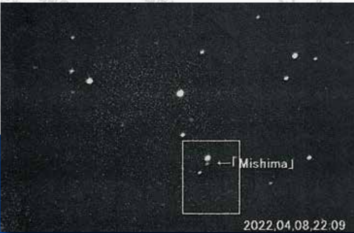
▲ 2022年に秋山さんが撮影した小惑星「Mishima」

上の写真の24分後に同じ場所を撮影した写真が下の写真です。 動かない星(恒星)の近くで、右に少しだけ移動している星があります。これが小惑星「Mishima」です。「Mishima」はおよそ4年をかけて太陽のまわりを1周します。 ※地球との距離:約3億km ※「Mishima」の大きさ:直径約10km