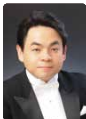
指揮 下野 竜也