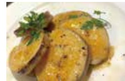
▲三島甘藷のゴルゴンゾーラソース (路地裏バル Danke)