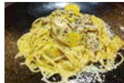
▲三島甘藷と金華豚のクリームパスタ (マリオパスタ)