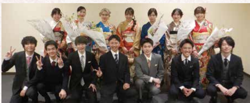
▲実行委員会の皆さん