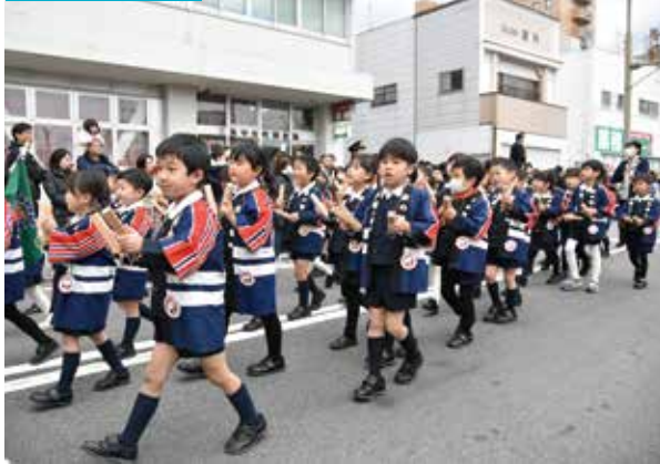
三島市消防出初式

「三島市消防出初式」が執り行われ、式典に続いて三島市消防団、富士山南東消防本部、幼年消防クラブのパレードが大通り商店街で実施されました。