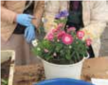
▲寄せ植え講座の様子