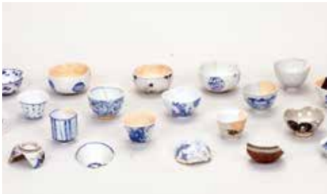
▲発掘調査で出土した陶磁器

れ、それらに伴って、大量の陶磁器が出土しました。出土した陶磁器は小型の碗類や土瓶などが中心で、茶屋での飲食に使用した食器類と考えられます。その出土量が江戸時代の後期以降に急激に増加するのは、旅ブームに乗った茶屋の発展を示しています。逆に明治時代半ば以降に激減するのは、鉄道の開通によって歩いて旅をする人が一気に減少して、茶屋が衰退する様を表しています。またイギリス製やオランダ製の陶器の小さな破片も出土していることから、江戸時代末期の山中宿では想像以上に他の地域との活発な交流があったことがうかがえます。