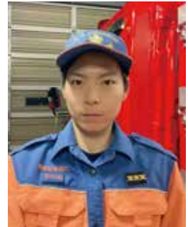
現第4分団員(継続) 三島市内勤務・在住

私が消防団に入団したきっかけは、大学で消防団員の募集を見かけ、興味を持ったことでした。月2回の訓練は学業にも支障がなく、無理なく活動を続けることができ、卒業後は地元を離れるつもりでしたが、消防団の活動を通じて地元への愛着が深まり、三島での就職を決めました。営利を超えて繋がる温かいコミュニティの存在を知ることができ、活動証明書(※)や消防団での経験は、就職活動においてとても役に立ちました。 就職を機に退団する人もいますが、退団を前に新入団員を指導し、自身が担ってきた役割を託す姿に胸が熱くなります。消防団は人の継承で成り立つ組織です。皆さんにも、その一員として次世代へ繋げる人になってほしいです。