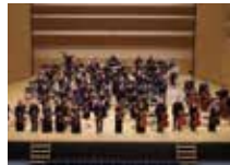
▲三島ゆうゆう祝祭弦楽団