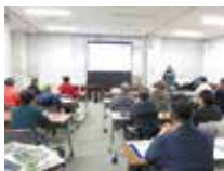
▲昨年のセミナーの様子