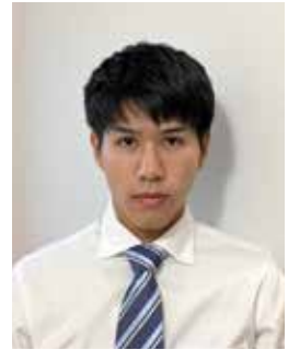
元第4分団員 現静岡市消防局所属

友人に誘われて消防団に入団し、火活動や地域貢献活動を通じて、多くの貴重な経験を積むことができました。さまざまな人と出会い、人間関係を密にしていけることができるのが、消防団の最大の魅力だと感じています。社会人となった今、多くの方と良好な関係性を築くことができているのも、消防団での経験があつたからだと思います。 消防団は自分自身を成長させる機会を与えてくれる素晴らしい組織です。また、仲間との絆や地域への貢献を感じられるため、ぜひ多くの方に入団してほしいと思います。消防団に興味をもちながらも入団を迷う学生や社会人のみなさんの第一步を強く応援しています。