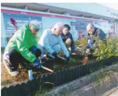
▲三島郵便局 OB の皆さん

また、当社では障がい者雇用を積極的に推進し、主に清掃活動に従事する社員を「チャレンジド」と呼んでいます。花壇の美観維持に努める活動も行っています。これからも郵便局をご利用のお客さまに折々の季節を感じ、楽しんでいただければと思います。