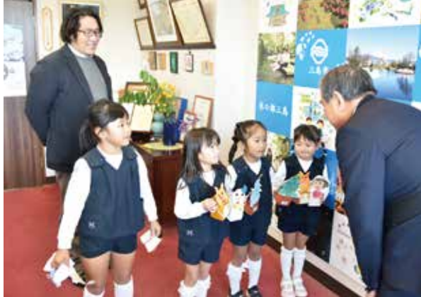
のびる幼稚園からの寄附受納

市の福祉の充実を図るため、学校法人のびる学園幼保連携型認定こども園のびる幼稚園より寄附をいただきました。