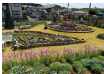
▲東大場花の会 (令和6年度団体の部市長賞)