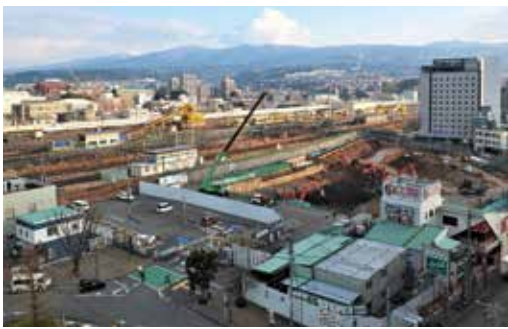
▲再開発事業区域の様子(1月中旬)

本事業は計画当初から地下水保全を大前提としており、杭を打たない直接基礎として、いるほか、掘削の際も地下水に影響を与えない工法を採用しています。