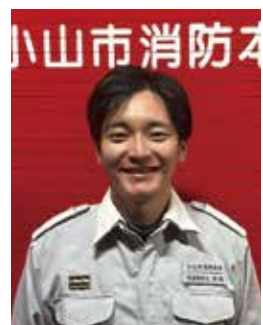
元第2分団員 現栃木県小山市消防本部所属

専門学校で救急救命士の資格を取得後、大学に編入学し、その頃から「将来は消防官として働きたい」と強く願っていました。学生の中から知識を得たいと思ったのが、消防団へ入団したきっかけです。慣れるまで時間がかかりましたが、統率力が養われ、普段の生活では経験することができない貴重な経験を積むことができました。また、人生の先輩でもある消防団のみなさんに助けてもらいながら、楽しく活動できたと思います。 私は消防団に入団し、さまざまな経験をさせていただきました。男女関係なく地域のために貢献できる素晴らしい組織です。皆さんの大切なまちで災害が発生する前に、消防団への入団を検討してみてくださいと思います。