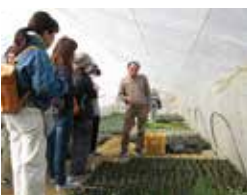
▲ハーブガーデンの様子