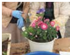
▲寄せ植え講座の様子