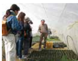
▲ハーブガーデンの様子