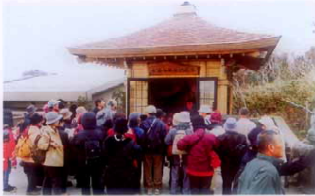
大涌谷延命地藏尊

かつて箱根は地獄でした！鎌倉時代、この地は地獄と呼ばれ、石仏や石塔が築かれていました。今も立ち上る硫黄の煙、煮えたぎる泉がそのように連想させます。しかしまた、この地獄から救済や極楽浄土を願った、地藏信仰の霊場としての地ともなりました。