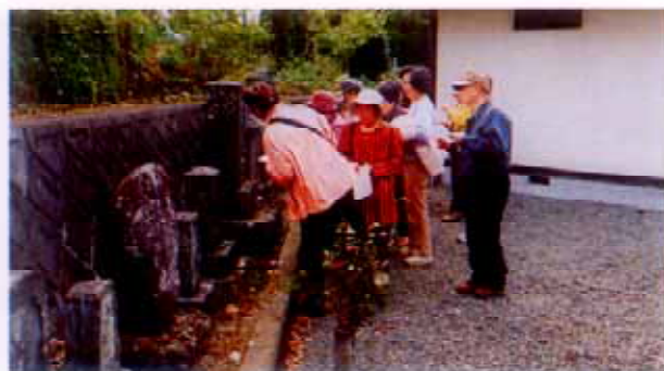
富士市中野地区から庚申堂

本年度の富士・沼津・三島3市博物館合同企画展「石は語る～祈りと想い」の三島での開催に先んじて開催中の富士市立博物館を訪ねました。