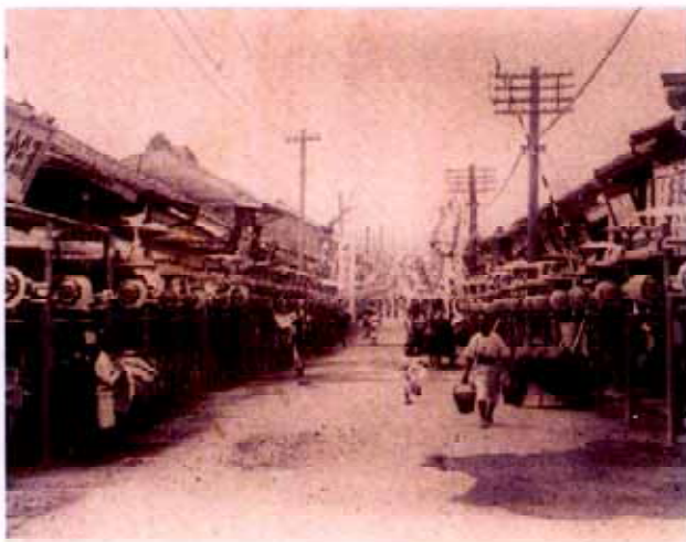
絵葉書 三島大社夏祭りの市街地 大正時代 大社から広小路方面