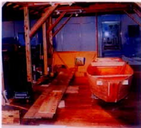
かりや 館内の木造船仮屋

9月21日、郷土資料館運営委員の視察として、千葉県浦安市郷土博物館及び市川市立歴史博物館・考古博物館を訪問しました。