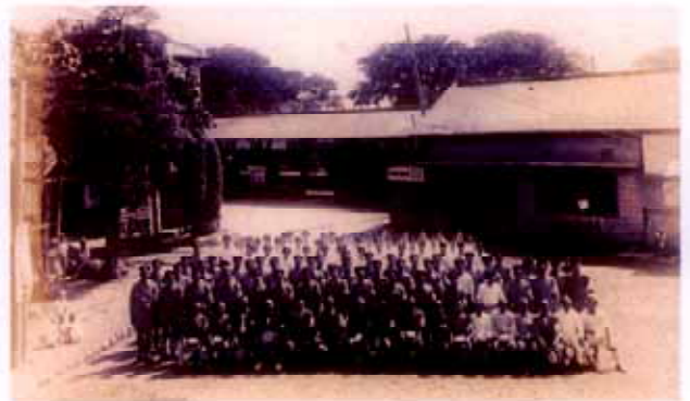
三島町駅（昭和6年頃・現 三島田町駅）チンチン電車は ここが始点で沼津へ向かった