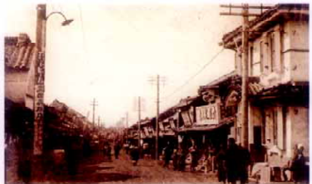
絵葉書 大正期の大社前、久保町通り（現 中央町） 右角は、三島銀行、広小路方向を望む

この頃、箱根山を車で越えることができるよう自動車道の整備がはじまり、大正13年完成します。また東海道線では丹那トンネル工事が本格的に始まり、とり残された町三島に、ようやく光が見え始めました。