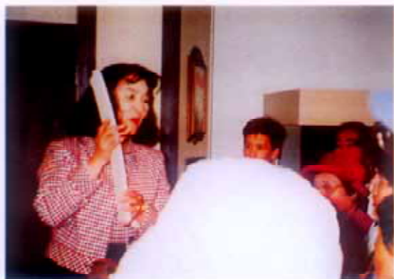
コンニャク石 (奇石博物館)

ここでは富士市の石造物、春耕の「道しるべ」(吉原から裾野までの街道筋の道しるべ)を中心に展示していました。また常設展示、別館の資料館、公園にある移築復元された建物群を見学しました。その後、富士市内中野地区の庚申堂と庚申塔群を散策し、富士宮市の奇石博物館を見学しました。奇石博物館では、コンニャクのようにしなる石やきれいな音が出る石、また化石類や不思議な色や形をした石の展示にあらたな関心を寄せることができました。