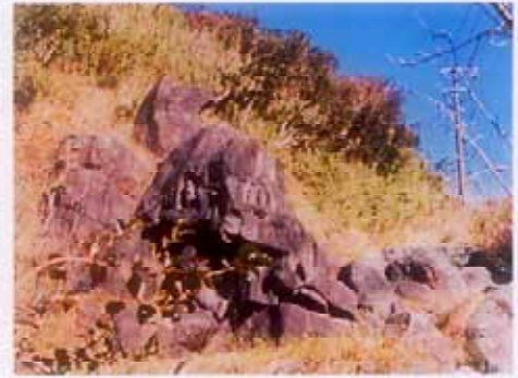
磨崖仏 二十五菩薩

コース 楽寿園駅前口→元箱根石仏・石塔群〔磨崖仏(俗称六道地藏)→磨崖仏(俗称応長地藏)→宝篋印塔残欠(俗称八百比丘尼の墓)→磨崖仏(俗称二十五菩薩西側)→五輪塔(俗称曾我兄弟・虎御前の墓)〕→元箱根石仏・石塔群ガイダンス棟→大涌谷延命地藏→大涌谷噴煙地→姥子散策路→弘法の硯石→姥子石仏群→賽の河原→楽寿園駅前口